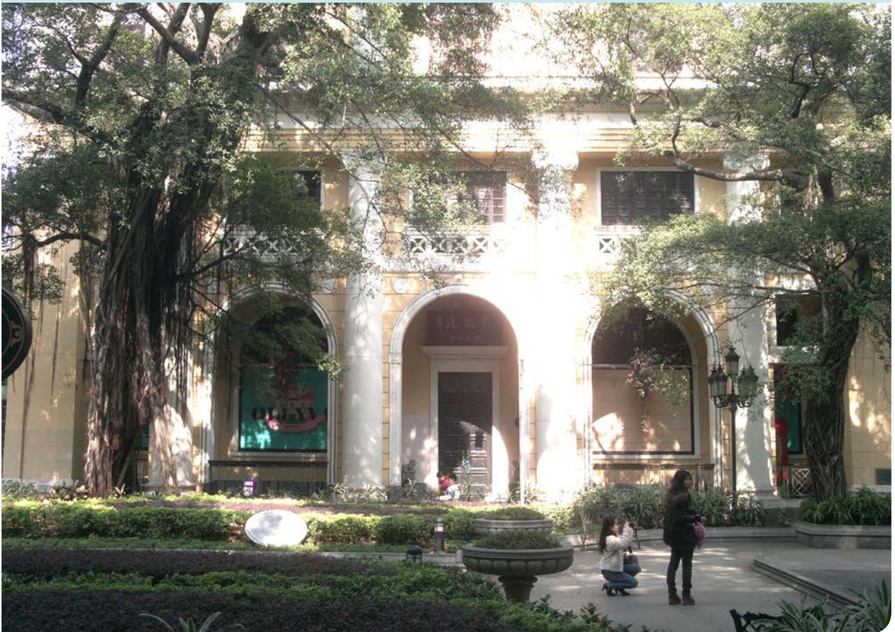
Het voormalige bankgebouw van City Bank op Shamian Island in Guangzhou

Ook de Wereldbank, die momenteel haar sociale- en milieuregels (safeguards) herziet, geeft er de voorkeur aan om haar sociale- en milieubeleid tot een technisch 'governance issue' te reduceren. De techniek van governance kan zonder veel moeite in het Chinese politieke en financiële systeem worden ingepast, omdat publieke zeggenschap over de besteding van geld hierbij ontbreekt. Het governance model past dus bij de wens van de Chinese politieke leiders om controle te hebben en te houden over geld en investeringen, zonder veel medezeggenschap van de burger.