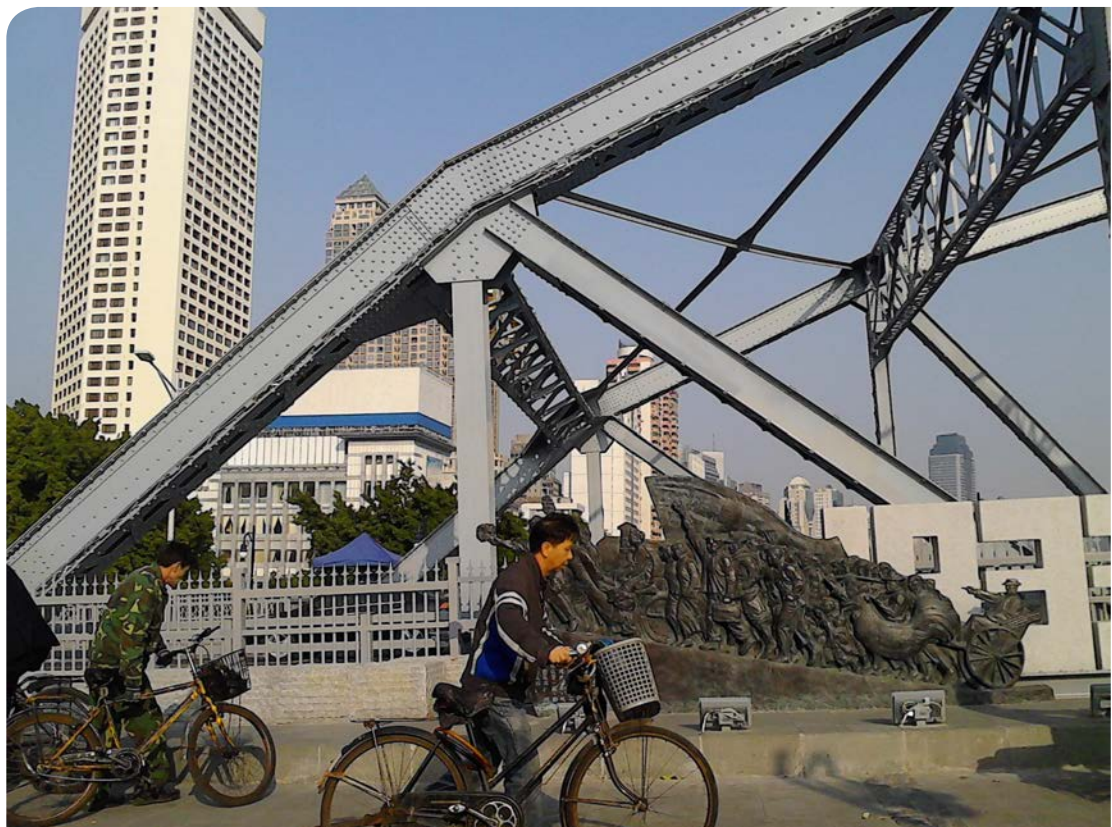
Brug in het centrum van Guangzhou

In veel landen buiten China kunnen maatschappelijke organisaties publieke multilaterale banken als de Wereldbank erop wijzen dat ze hun eigen regels moeten naleven. Daarnaast kunnen zij ook hun overheden benaderen, die een aandeel hebben in deze multilaterale banken en die in het bestuur van die banken meebeslissen over de besteding van het geld. De parlementen van landen hebben hierop een controlerende functie. In China is de werkelijkheid heel anders. Voor maatschappelijke organisaties is het dan ook belangrijk om te onderzoeken hoe ze in deze Chinese politieke context toch invloed uit kunnen oefenen.