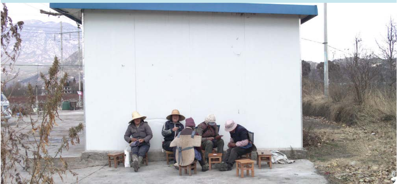
Chinese vrouwen op het platteland

In China zie je hierdoor, net als op andere plekken in de wereld, een groeiende groep super-vermogenden ontstaan en tegelijk een exponentiële toename van economische ongelijkheid. Deregulering leidt tot kartelvorming: het monopolie dat de staat had op het scheppen van geld, komt te liggen bij een kleine groep banken. Deze banken (lees: vermogenden) kunnen dan ook zelf de prijs van geld (de rente) vaststellen, in plaats van dat deze door een vrije markt van vraag en aanbod wordt bepaald.