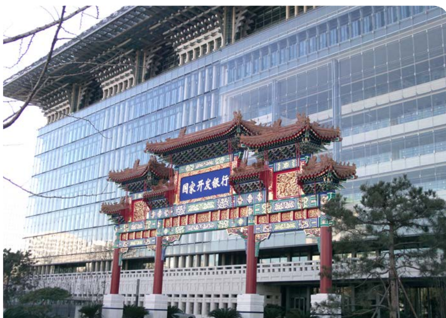
China Development Bank

Green Watershed houdt in de gaten of Chinese banken de sociale- en milieuregels naleven en publiceert elk jaar een rapport waarin de prestaties van Chinese banken in maatschappelijk verantwoord ondernemen beoordeeld, gewaardeerd en gerangschikt worden. Hoe staat het met openbaarheid van gegevens, milieu-, sociaal- en personeelsbeleid, hoe ziet de organisatiestructuur eruit (heeft de bank milieuprojecten en een milieuafdeling?), public relations en portfolio (investeert de bank in groene sectoren van de economie en om hoeveel geld gaat het dan?).